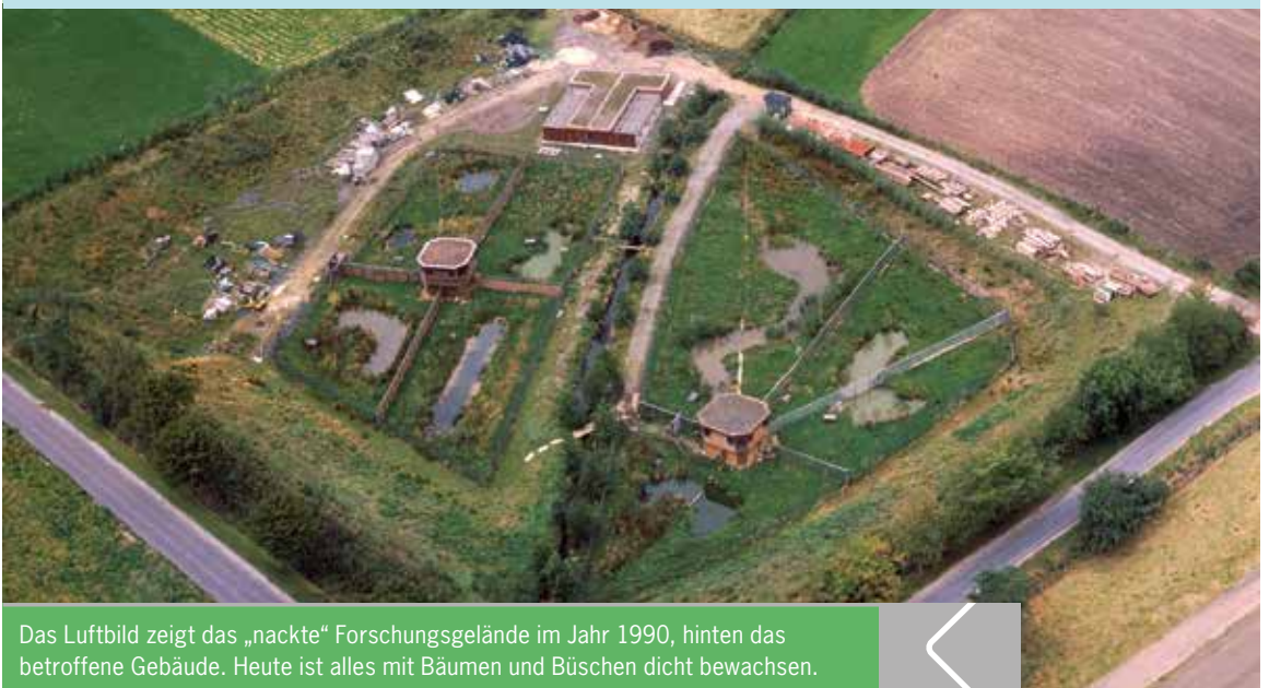
Das Luftbild zeigt das „nackte“ Forschungsgelände im Jahr 1990, hinten das betroffene Gebäude. Heute ist alles mit Bäumen und Büschen dicht bewachsen.