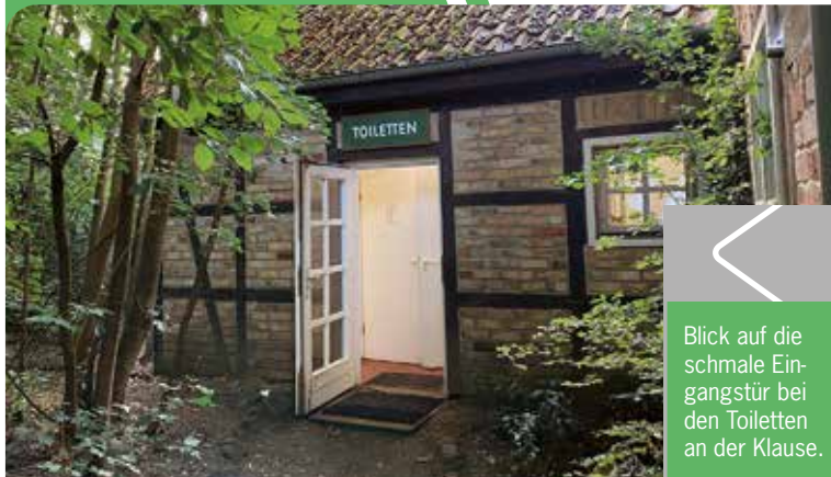
Blick auf die schmale Eingangstür bei den Toiletten an der Klause.

zu 15 Minuten oder sogar länger gehen, um den entsprechenden Raum zu erreichen.