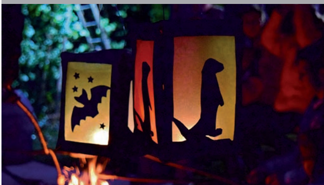
Laternenumzug durch's OTTER-ZENTRUM

Teilnahme kostenlos. Treffpunkt vor dem Haupteingang.