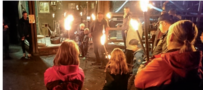
Abendführung: Nächtliche Pirsch

Anmeldung: bis 13.10., unter gruppen@otterzentrum.de oder 05832-9808-20. Treffpunkt vor dem Haupteingang.