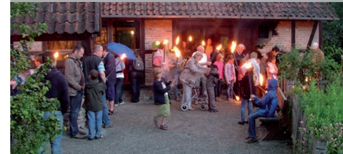
Abendführung: Nächtliche Pirsch

Anmeldung: bis 25.10., unter gruppen@otterzentrum.de oder 05832-9808-20. Treffpunkt vor dem Haupteingang.