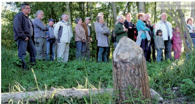
Biber-Führung in Wolfsburg

Anmeldung: bis 02.11., a.willharms@otterzentrum.de oder 05832 9808-34. Treffpunkt wird bei Anmeldung mitgeteilt.