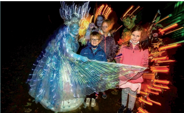
4 Tage „Lichterwelten“ im September

Kosten: € 14,- Erw., € 10,- Ki. (4-17 J.)